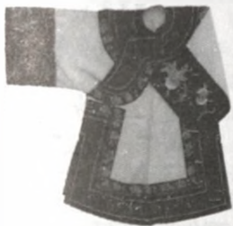
大镶大沿果绿女褂

大镶大沿果绿女褂 汉族女子上衣。清末民初流行于京津地区。丝质,立领,大襟,衣身较宽大,内有衬里。除浅绿色丝绸衣身外,领口、袖口、衣襟、下摆等处都镶有较宽的花边,并绣花卉及吉祥图案。清初镶绣只施襟边及袖端,而且颜色较素淡。至咸丰、同治间,妇女服饰的镶缂逐渐增加,从三镶三缂、五镶五缂,发展到十八镶缂。以至“一衫一裙,本身细价有定,镶缂之